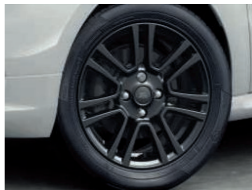
Jantes en alliage 16" à 7 branches finition « Magnetic Grey » (de série)