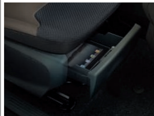
Tiroir de rangement sous le siège côté passager (de série)