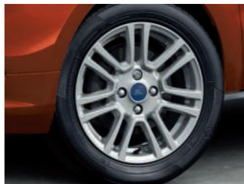
Jantes en alliage léger 16" à 7 branches (de série)