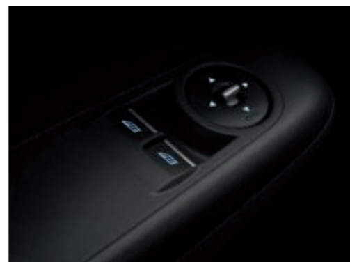
Vitres électriques à l'avant, à impulsion côté conducteur et passager (de série)