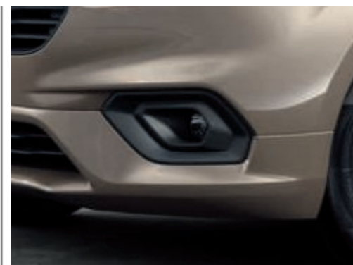
Phares antibrouillard (de série)